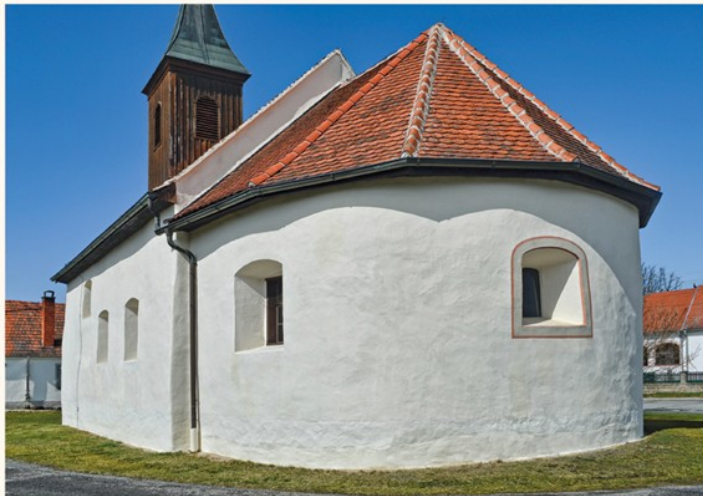
Die katholische Filialkirche Siget in der Wart (Ansicht von Südosten). Der Festtag des Apostels Paulus, dem das Gotteshaus ursprünglich geweiht war, ist der 29. Juni. Bemerkenswert ist, dass durch den im 13. Jahrhundert erfolgten Wechsel zum heiligen Ladislaus das Patroziniumsfest nur um einen einzigen Tag, auf den 30. Juni, verlegt werden musste.

Erst in den letzten Jahren wurde erkannt, dass auch das Burgenland eine Reihe von frühmittelalterlichen Sakralbauten besitzt, die dem Erzbistum Salzburg im 9. Jahrhundert n. Chr. als Stützpunkte bei der Missionierung Oberpannoniens dienen. Archäologisch nachgewiesen sind frühmittelalterliche Kirchen in Bruckneudorf, Leithaprodersdorf, Eisenstadt, Rust (Fischerkirche), Rattersdorf, Oberschützen, Deutsch Schützen, Hannersdorf und St. Martin in der Wart. Aufrecht stehen heute noch jene von Goberling, Siget in der Wart, Güssing und Zahling, etwas verzogene, einfache Apsidensäle, die bislang in Unkenntnis frühmittelalterlicher Merkmale stets dem 13. Jahrhundert zugeordnet wurden.