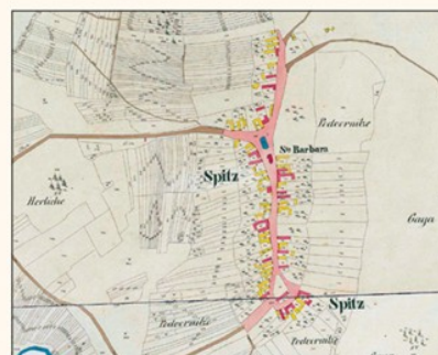
Spitzzicken auf dem Franziszeischen Kataster von 1857. Bemerkenswert ist der Ortsname »Spitz«. Die ursprünglich vorhandene frühmittelalterliche Kirche wurde um 1820 durch die noch heute bestehende Barbarakirche ersetzt.