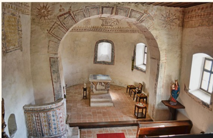
Die frühmittelalterliche Filialkirche zum heiligen Ladislaus gehört zu den bemerkenswertesten Kirchen des Burgenlandes. Die Malereien werden allerdings erst dem 16./17. Jahrhundert zugeordnet, wobei die Bedeutung der Darstellungen noch nicht restlos geklärt ist.

Und nun zur neuen These, wonach Weride im burgenländischen Siget zu finden ist. Im Vordergrund steht zweifellos die Begriffsverwandtschaft des althochdeutschen und des ungarischen Ortsnamens, wobei nicht nur an eine von Wasser umgebene Insel, sondern etwa auch an eine aus dem Sumpf aufragende Erhebung zu denken ist. Hinzu kommt in Siget das Vorhandensein eines frühmittelalterlichen Kirchengebäudes, dessen Patroziniumswechsel auf die Ausrichtung der Längsachse keine Abweichung erzeugte. Das dritte Argument für eine Lokalisierung in Siget liegt in der Überlieferung begründet, dass Erzbischof Adalwin bereits einen Tag später, am 14. Jänner, eine weitere Kirche in Spizzun/Spitz weihte. Ausgehend von der Tatsache, dass Adalwin an einem Wintertag keine allzu große Strecke zurückgelegt haben dürfte, bietet sich hier das von Siget nur 2,5 Kilometer entfernte liegende Dorf Spitzzicken an, das auf dem Franziszeischen Kataster aus dem 19. Jahrhundert noch mit seinem ursprünglichen Namen »Spitz« bezeichnet wird.