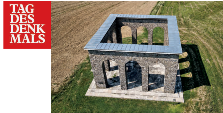
»Anschlussdenkmal«, 2020