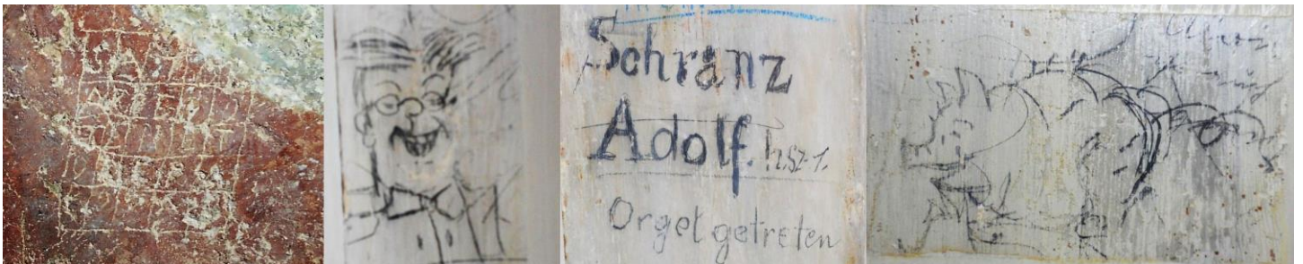
Graffiti: magisches Quadrat aus dem Mittelalter und Schülerzeichnungen.

Graffiti: Aufmerksame Besucher können bei beiden Führungen Graffiti entdecken: Mittelalterliche Einritzungen von Kirchenbesuchern in der Friedhofskirche und Zeichnungen von Schülerhand am Orgelgehäuse.