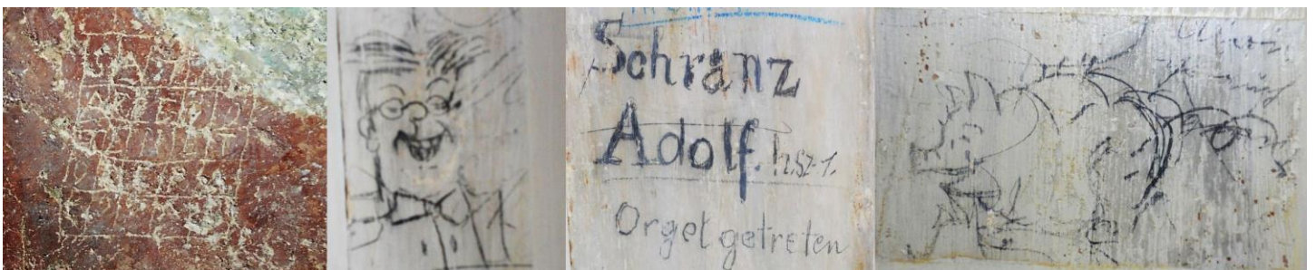
Graffiti: mágikus négyzet a középkorból és diákok rajzai.

Graffiti: Figyelmes látogatók a vezetések során graffitikat is felfedezhetnek: a temetői templomban hívek vagy látogatók középkori keletű bevéséseit, az orgona befoglaló keretén diákok rajzait.