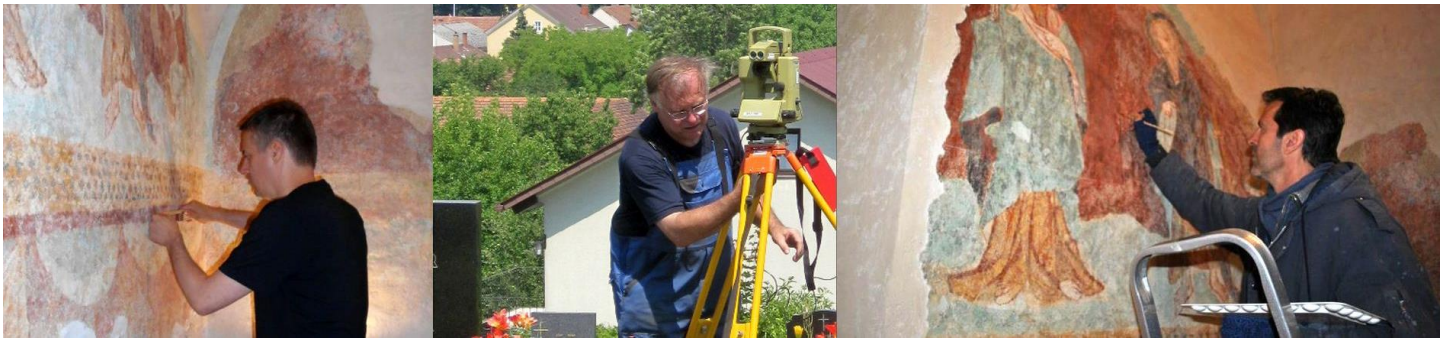
Tudományos munkálatok a középkori temetői templomban